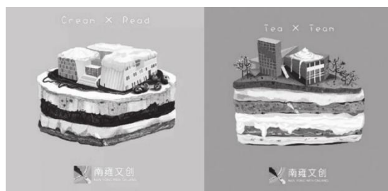
图 6：“第一口南大的滋味”南大蛋糕

以湖南大学为例，湖南大学集合校园景观旅游，又有着“千年学府，百年名校”的美誉，具有优美的景观氛围与深厚的文化底蕴，来湖南大学、岳麓书院的游客络绎不绝，在此基础上设计能够体现湖南大学的文创产品，不仅仅能够提升校内教师学子对湖南大学的热爱程度，还能提高游客对湖南大学的纪念意义。同时将湖南大学“年轻化”的品质高的校园文创产品推广于融媒体 5G 时代当中，实现社会与经济的效益丰收[10]。就国内而言与湖南大学类似的许多高校在文创产品创新的越来越丰富，如南京大学的文创设计团队将蛋糕与南京大学校园文化结合，名为“第一口南大的滋味”蛋糕产生视觉与味觉的双重享受（图片 6）；清华大学充满理工科风格并与传统手工艺结合的创意丝巾设计（图片 7），展现清华校园的独特风貌同时还融入社会生活。