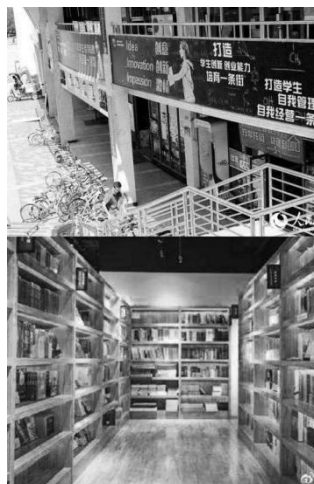
图5: 四川大学双创街（网络）