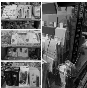
图 2 现有文创产品