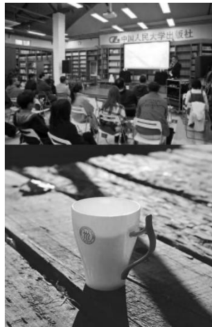
图4 中国人民大学“人大文创”精品店（网络）