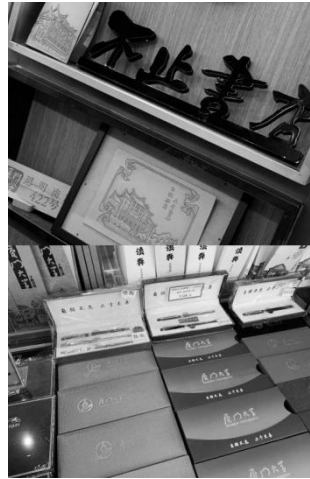
图3 厦门大学“不止书屋”