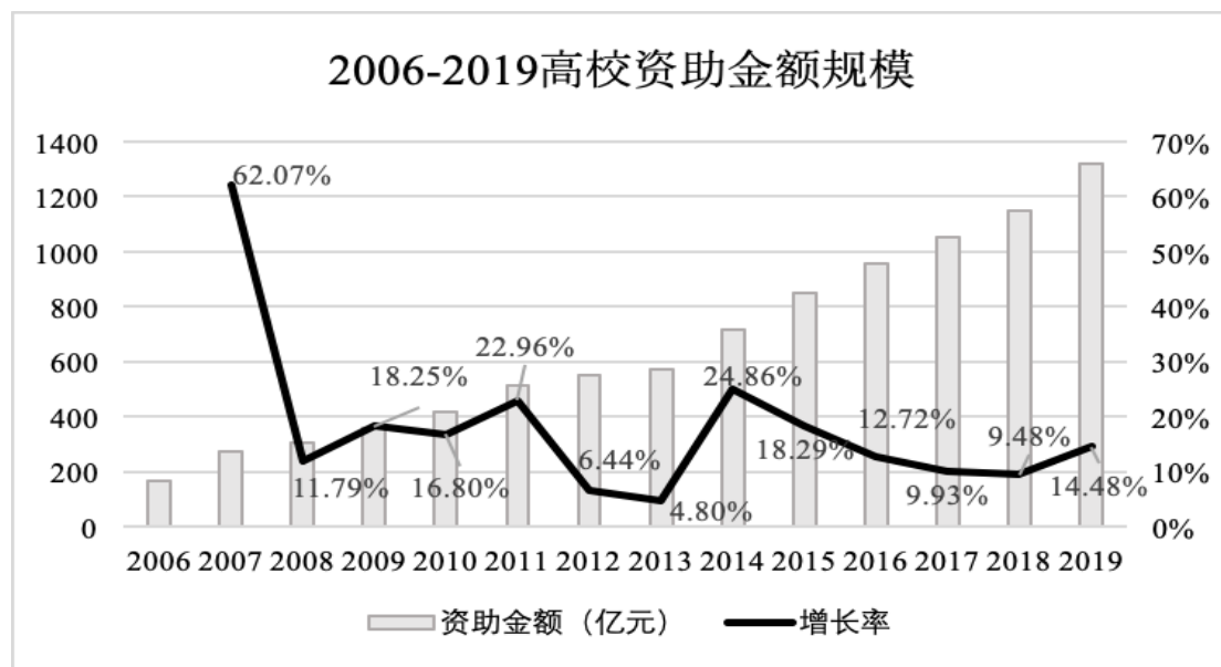
图 1 2006-2019 高校资助金额规模

率逐步稳定在近几年的 10%左右。从资助金额来源来看,目前高校资助金额主要来源于财政支出,资金来源不均衡,结构有待优化。