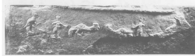
图二 山东滕县山亭出土斗鸡图 选自《山东汉画像石选集》图二四六

密县后士郭村出土的斗鸡画像石（图六）上，观众或表情紧张，或为斗鸡助威。 1 斗鸡、蹴鞠不需要占用太大场地，也不需要太多时间和钱财 2 ，去市内闲逛的百姓通过这些方式娱乐应该还是比较合适的。