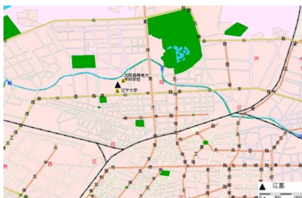
图一、辽墓地理位置图

“国际交流大楼”工程位于沈阳市皇姑区崇山中路66号的辽宁大学院内东北部(图一), 北、西面为沈阳高等电力专科学校, 东面是辽大浴池, 南面为辽大操场, 占地14520平方米。该工程位于沈阳市划定的“辽大、百鸟公园遗存”文物勘探范围之内。此地区以前曾发现过新乐上层文化遗址及墓葬。