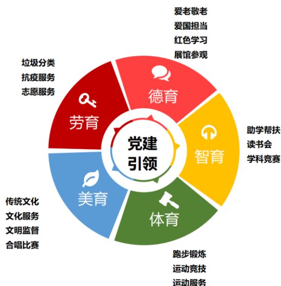
图2 U大学学生党支部“党建+”五育并举工作法

学生党支部坚持党建引领，强化理论学习、组织建设和社会服务，形成“党建+”五育并举支部工作法（见图2）。