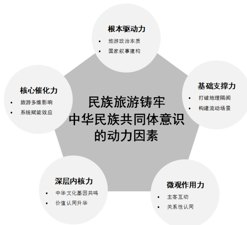
图1 民族旅游铸牢中华民族共同体意识动力因素

铸牢中华民族共同体意识属于一项规模宏大的系统工程，民族旅游能够成为推动这一进程的有效载体，原因在于其内部蕴含着多种、复合且相互交织的动力源。这些动力并非简单排列，而是形成一个由根本驱动力、基础支撑力、核心催化力、微观作用力、深层内核力共同构成的协同系统（图1），持续为共同体意识的生成与巩固提供能量、创造条件、搭建平台并注入灵魂。