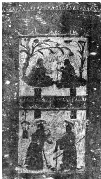
图3 中室南壁东段画像

石面纵 120CM, 横 42CM。画面分为二层。上层刻仓颉造字时求教于老人的故事, 左者四目、披发、长须、衣兽皮, 席地而坐, 榜题“苍颉”, 与右侧持杖的老人交谈。下