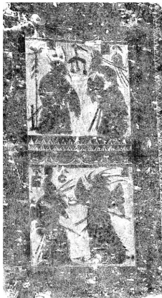
图1 中室西壁南段画像

石面纵 119CM，横 66CM。画面分为二层。上层刻孔子见老子，老子居左，孔子在右，二人皆佩剑，作交谈状。下层刻二人佩剑，怒目而视，有榜无题。