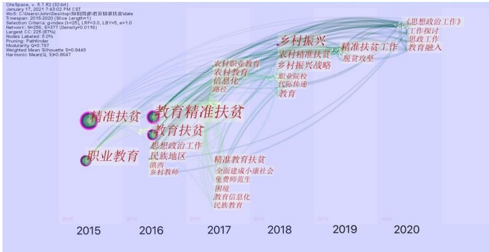
图 6 教育精准扶贫研究关键词共现网络时间迁移图

扶贫研究关键词主要有思政工作、工作探讨等,可见,经过几年的精准扶贫实践人们越来越认识到推进思政教育融入农村精准扶贫工作的重要性 [10] 。如今,第一个一百年已经到来,广大农村精准扶贫工作出现了全新变化和时代要求。精准扶贫既需要良好的产业方案、政策扶持,也需要激发贫困户的脱贫斗志 [11] 。因此,在当前推进农村精准扶贫工作,需更加注重开发思政教育资源,从而深度挖掘贫困成因、精准解决贫困问题。