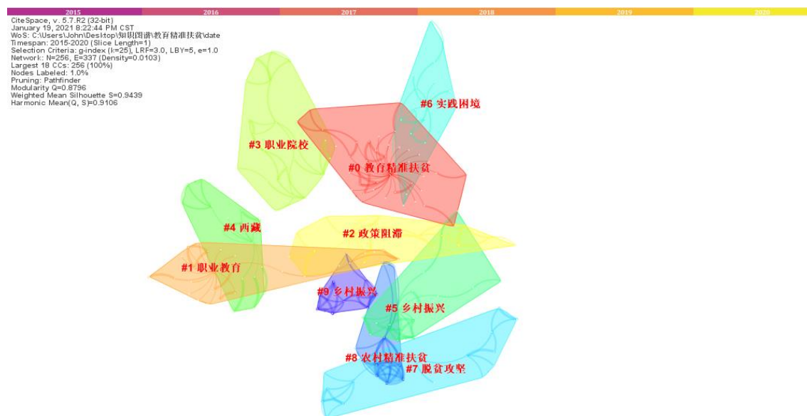
图 4 教育精准扶贫关键词聚类图谱

此外, CiteSpace 可以对关键词网络进行了聚类, 进而挖掘潜在的研究热点。在教育精准扶贫关键词聚类图谱中(如图 4), 左上角是该网络的相关指数, 其中 Q 值是衡量聚类网络是否显著的指标, 该图谱中 Q=0.8796 , 说明此图谱中的聚类结构成显著效果; Silhouette 值表示聚类网络的同质性, 值越大表示聚类网络的同质性越高, 该图谱中 Silhouette 值为 0.9106, 说明该图谱中聚类网络的同质性较高 [4] 。另外每个聚类结构都与其它聚类结构存在不同程度的重合, 这也在一定程度上表明教育精准扶贫研究热点较为集中、已经形成了较为成熟的研究主题。通过图 5 可以发现, 教育精准扶贫研究排名前十的关键词聚类标签分别为教育精准扶贫、职业教育、政策阻滞、职业院校、西藏、乡村振兴、实践困境、脱贫攻坚、农村精准扶贫、乡村振兴。这些聚类标签体现了教育精准扶贫研究的热点关注。可见, 近年来我国教育精准扶贫研究前瞻主要包括以下几个方面。