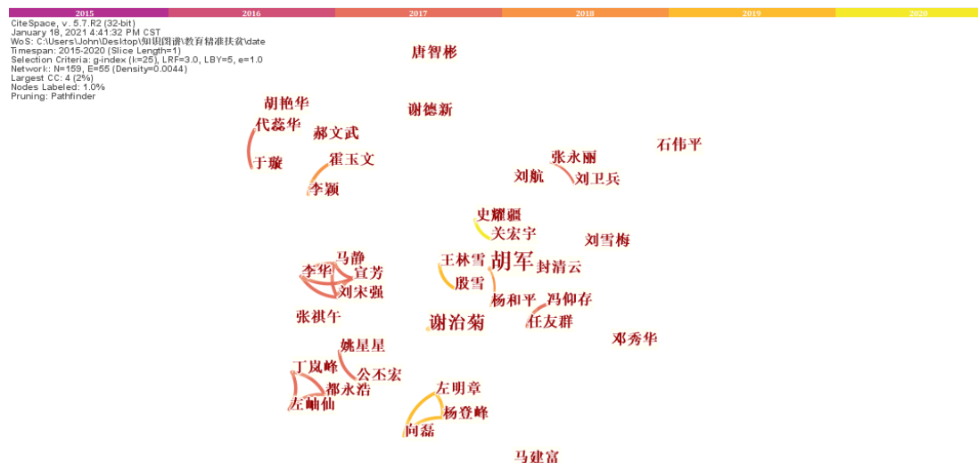
图 2 教育精准扶贫研究作者合作图谱

利用 CiteSpace5.7 软件生成教育精准扶贫研究作者合作图谱(如图 2)。结果显示, Nodes (节点) 为 159 个, Links (连线) 为 55 条, 其中 Nodes 代表着在教育精准扶贫领域发表文章的研究者, 其大小由作者产出文献量决定。Links 将不同的作者连接起来, 表示不同作者之间的合作关系, 其粗细程度代表了作者之间合作的密切程度。Density 为图谱网络密度, 该图谱 Density=0.0044, 图谱网络密度极小, 这表明在教育精准扶贫领域还未形成一支稳定、连续的研究者群体, 研究力量相对分散, 作者大多独立研究, 相互之间合作很少, 如发文较多的谢治菊等都是孤军奋战。胡军与杨和平、李华、马静、宜芳、刘宋强等研究者之间虽然有合作, 但合作次数有限且未形成联系密切的研究团体。这在很大程度上不利于教育精准扶贫研究的深入发展。未来教育精准扶贫研究应注重和加强研究者之间的合作与交流。