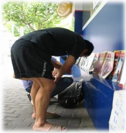
图1 整修前沈大叔摊位

博弈，而对于权力资源占据资本较大的一方则更会利用正式的一些政治手段扩大自己的地盘。