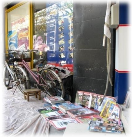
图2 整修期间沈大叔摊位