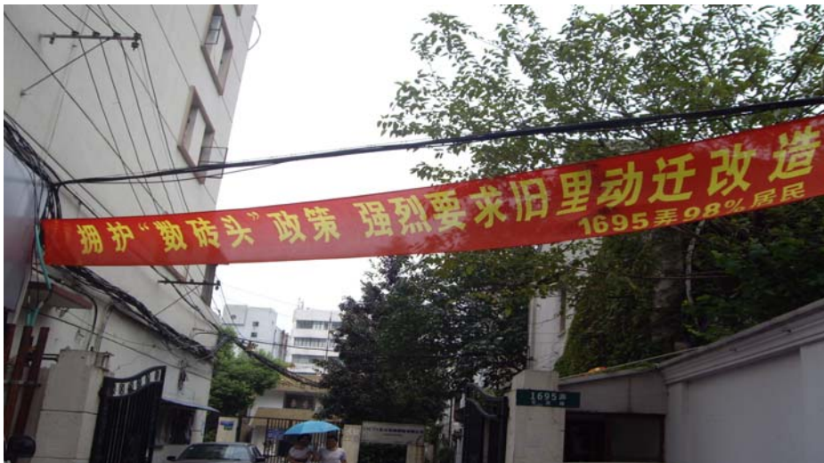
图 2 1695 弄临 PL 路的入口所挂横幅

但是，一年多过去了，北面的 HJ 路基地和东面的 107 街坊相继开工建设，1695 弄的动拆迁工作还不建踪影。部分居民私下串联，自己调查摸底了解弄内居民的动迁意愿，根据调查结果，绝大部分居民都愿意参与动拆迁，只是不知道政府的规划是怎么安排。