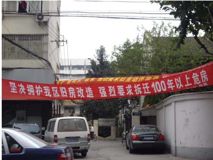
图 3 1695 弄临 PL 路的入口所挂横幅为居民所挂，落款是“1695 弄 98%的居民”

场评估”是指无论居民原住房，还是安置房均以市场评估折算价值，维护拆迁人和被拆迁人的市场等价值原则。1695 弄居民显然绝大部分也赞成这样的政策。网友 li_zheren 曾发牢骚“ZF 也太会算计了，人头少的地方就数人头，拿钱往外环送，现在这个地方人头多了，就开始数砖头了，连选择的权利都没有了”。另外一位网友也附和说，（拆迁政策）真倒是真的，原拆原还，保障型住宅基地试点（全市 3 个地方，报纸上也登过），不过作为第一批小白鼠，不知道要几年才能拆完建完，而且从某些区的情况来看，每户增加 1-2 平方的面积，简直是头撞墙、愤怒。不过，1695 弄的网友 pi888888 却说，不管数啥，只要有这样的市政动迁就蛮好啦，我想他来拆呀，就是不来啊。这些反映了旧里居民的强烈愿望。