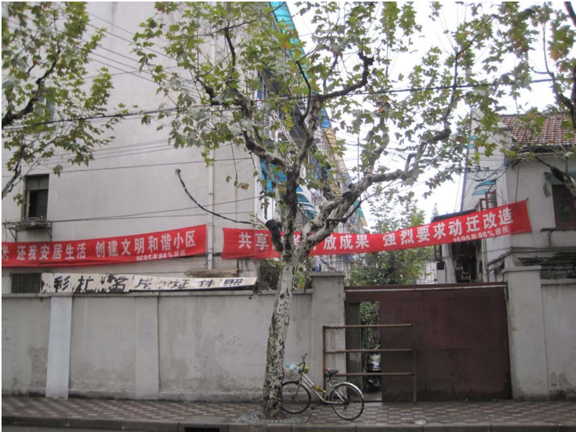
图4 被迫挂到小区较偏僻的侧门的横幅（2009年11月13日摄）